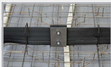
MASTER-MultiFlex na výztuži