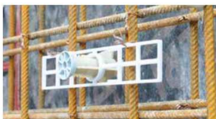
V případě vnitřního bednění, sloupy nebo ocelového bednění se pomocí výztužné desky připevní na výztuž

Připevněte montážní desku k výztuži → kužel je přitlačen k bednění. S montážní deskou a prodlužovacím pouzdrům se pracovní zatížení zvýší na 45 kN. U izolačních vložek v bednění: protáhněte prodlužovací díl izolací. U stropních nebo podlahových panelů je montážní deska připevněna k horní výztuže.