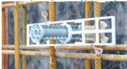
Při použití s montážní deskou a prodlužovacím pouzdrům se zvětší hloubka a tím zaručené přípustné pracovní zatížení zvýší na 4 500 kg (45 kN).