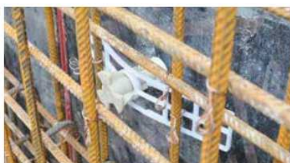
Kužel je pomocí montážní desky optimálně přitlačen k bednění.