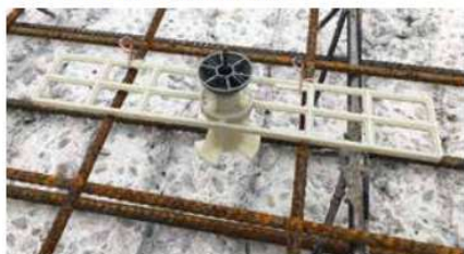
Při použití na stropní nebo podlahové desky je kotva UNI připevněna k horní výztuži pomocí montážní desky.