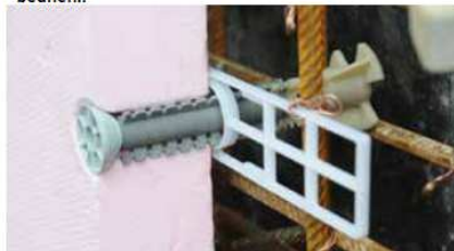
Použití plastové kotvy UNI s montážní deskou a prodlužovacím pouzdrům pro izolační vložky v bednění.