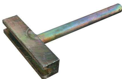
Klíč na spínací tyče Albanese 703015

Výhodou použití těchto prvků je jednoduché a bezpečné použití. Díky těsnící fazetě u kónusu nedochází k zatékání cementového mléka do závitu a nedochází ke ztrátě času při čištění. Připevnění k výztuži pomocí montážní desky → žádné otvory pro hřebíky → chrání bednění. Zaručené, přípustné pracovní zatížení: 35 kN