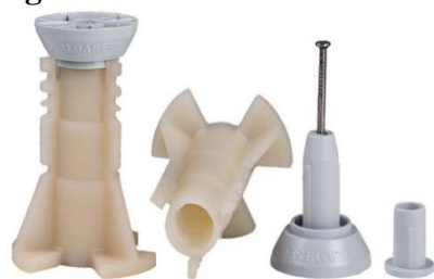
UNI kotva plastová s montážním kuželem a zátkou.

Po zabetonování do konstrukce slouží ke kotvení pomocí spínací tyče se závitem DW15 Před betonáží je kotva UNI přibitá na bednění montážním kuželem nebo připevněna k výztuži montážní deskou. Kotva má vnitřní závit DW15 dlouhý 65 mm, kotva je vyrobena z plastu . s držákem pro montážní desku a prodlužovacím pouzdrém Vytahovací sílu kotvy UNI lze pomocí montážní desky a prodlužovacího pouzdra zvýšit na 4 500 kg!